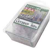
バリューパック 50本入